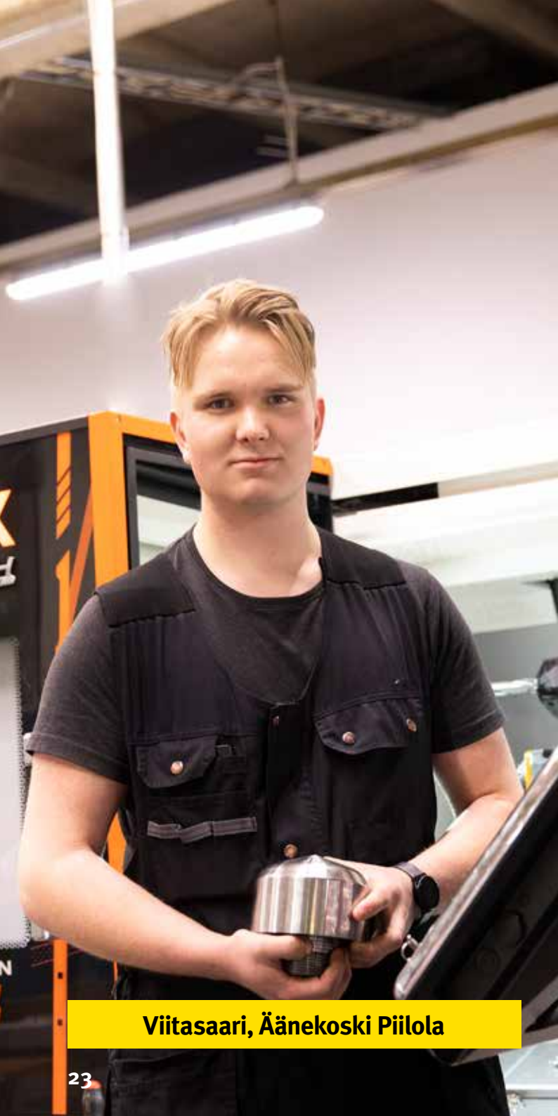
Viitasaari, Äänekoski Piilola